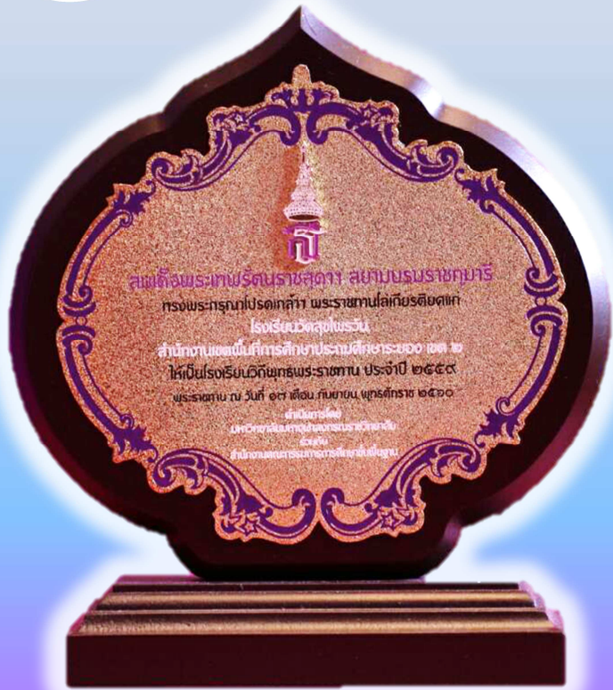
โล่รางวัลโรงเรียนวิถีพุทธพระราชทานประจำปี ๒๕๕๙